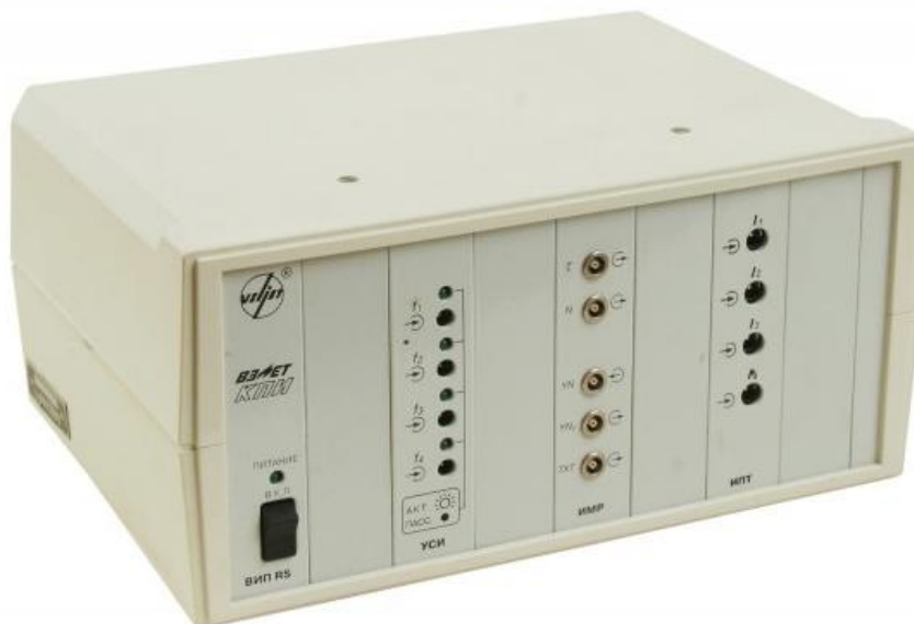
Рисунок 1 - Общий вид комплексов поверочных «ВЗЛЕТ КПИ»

Для защиты от несанкционированного доступа комплексы должны быть опломбированы в соответствии с рисунком 2.