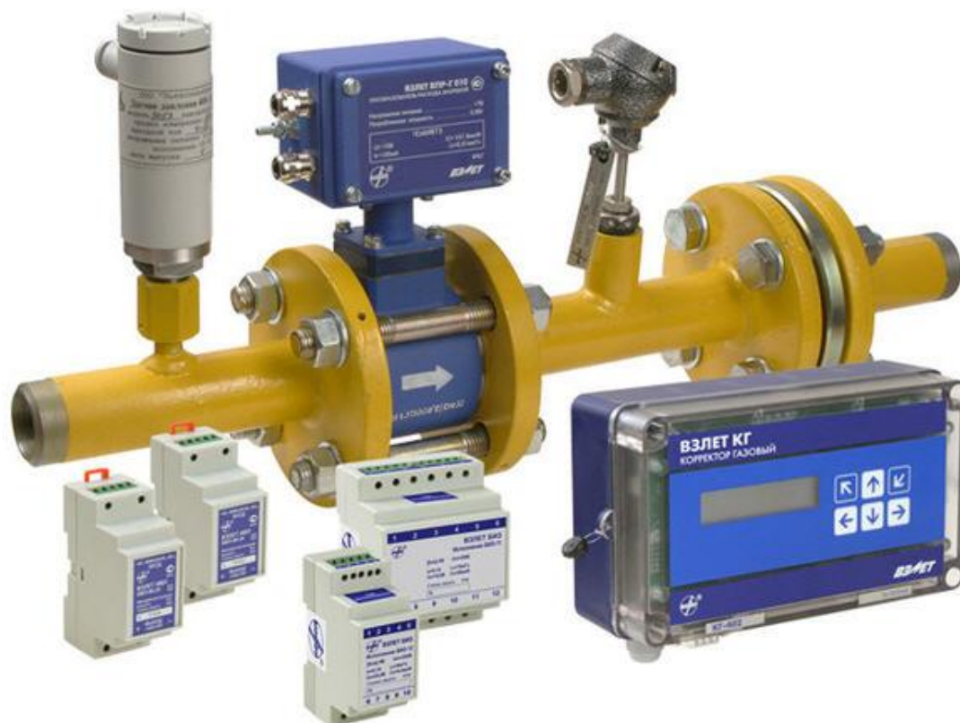
Рисунок 1 - Общий вид расходомеров-счетчиков вихревых «ВЗЛЕТ ВРС»

Общий вид расходомеров приведен на рисунке 1.