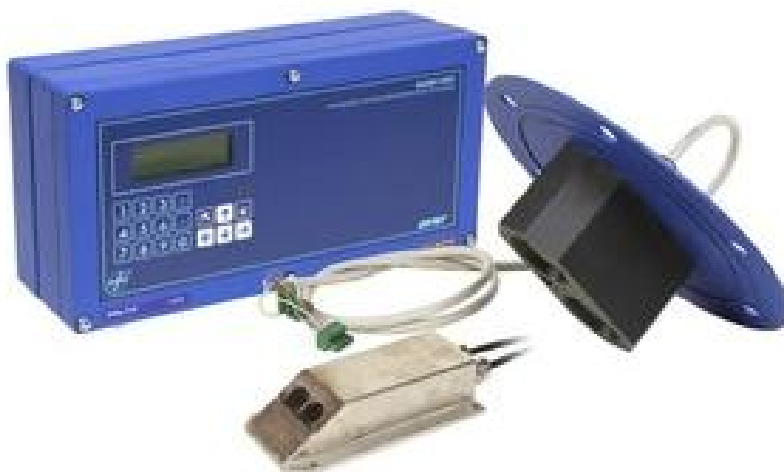
Рисунок 1 - Общий вид расходомеров-счетчиков ультразвуковых «ВЗЛЕТ РБП»

Общий вид расходомеров приведен на рисунке 1.