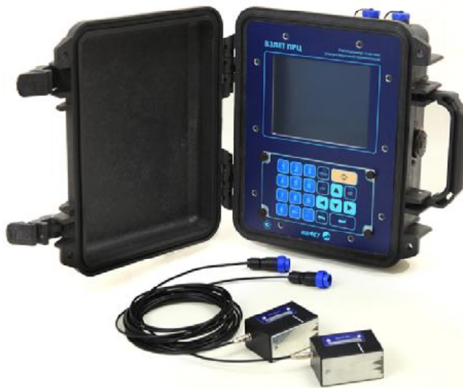
Рисунок 1 - Общий вид расходомеров-счетчиков ультразвуковых переносных «ВЗЛЕТ ПРЦ»

Общий вид расходомеров приведен на рисунке 1.