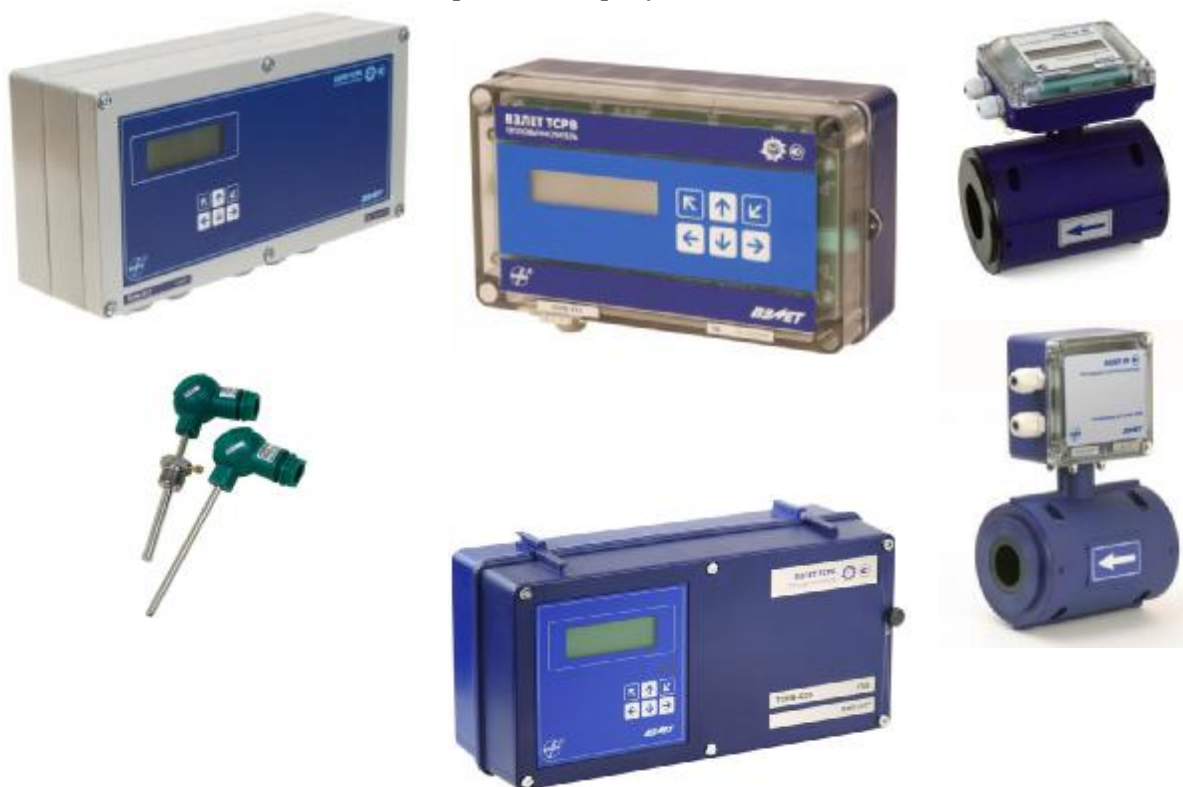
Рисунок 1 - Общий вид теплосчетчиков - регистраторов «ВЗЛЕТ ТСР-М»

Общий вид теплосчетчиков приведен на рисунке 1.